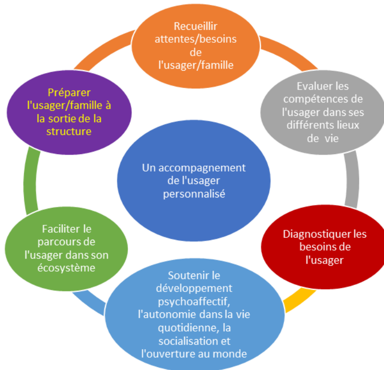
Schéma synthétique des objectifs dans une dynamique de parcours

Le SSEFS, SESSAD spécialiste, véritable ressource sur le territoire s'inscrit en complémentarité des acteurs intervenant dans la dynamique du projet de vie de la personne accompagnée, avec des ressources techniques et humaines, dans le respect des principes déontologiques et éthiques.