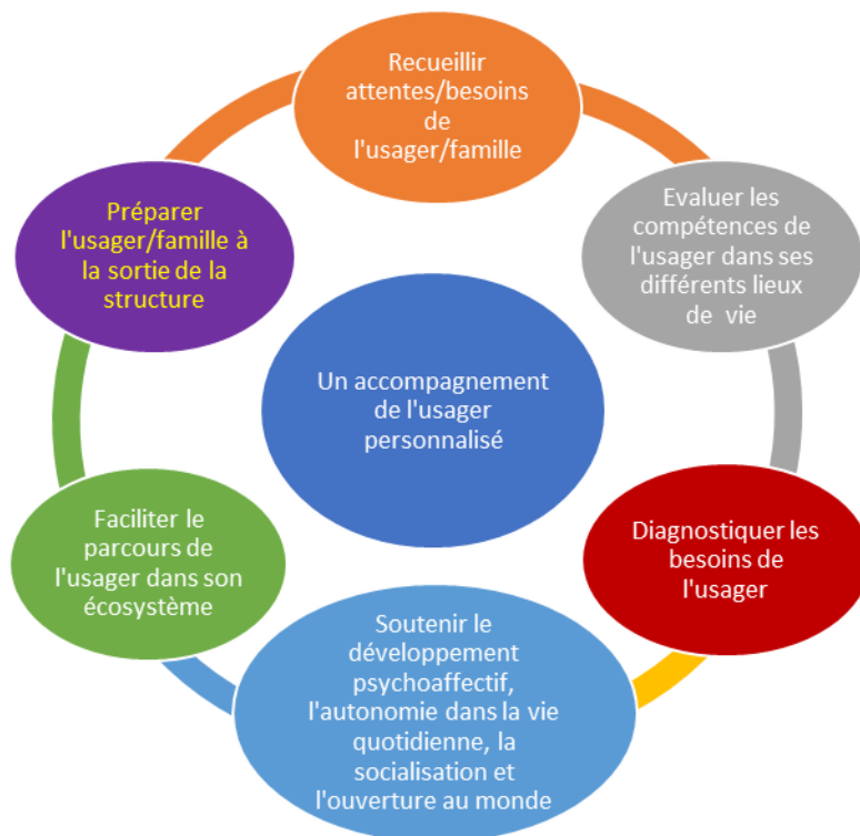
Schéma synthétique des objectifs dans une dynamique de parcours